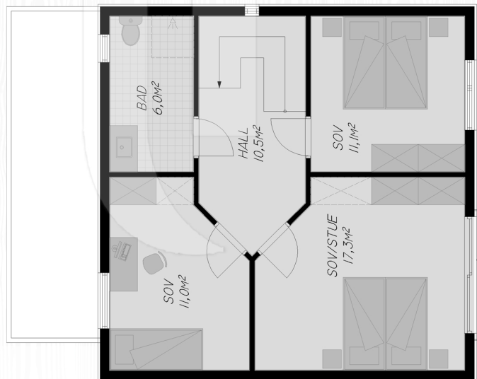
Plan 2. etasje