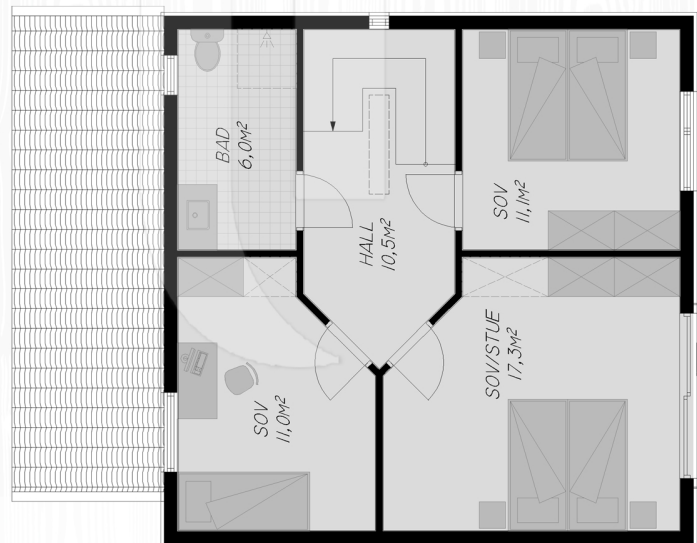
Plan 2. etasje