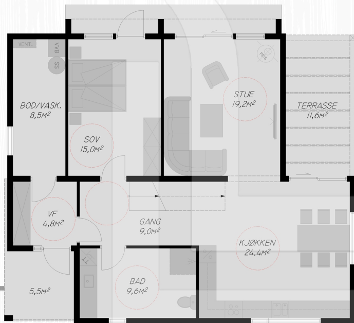
Plan 1. etasje