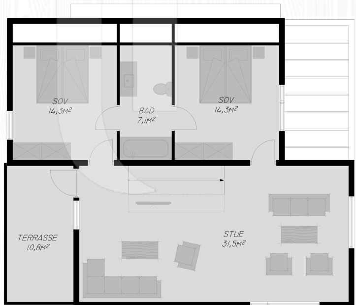
Plan 2. etasje